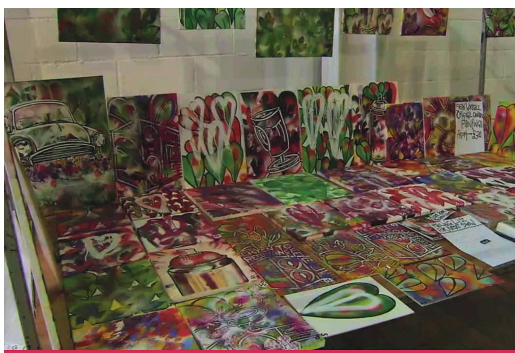
New art forms - British street art